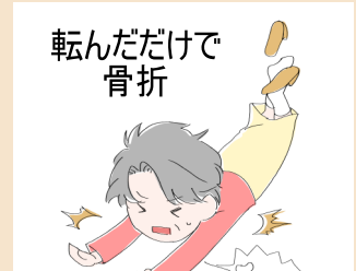
転んだだけで 骨折