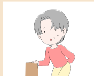
背中や腰が曲がってきた